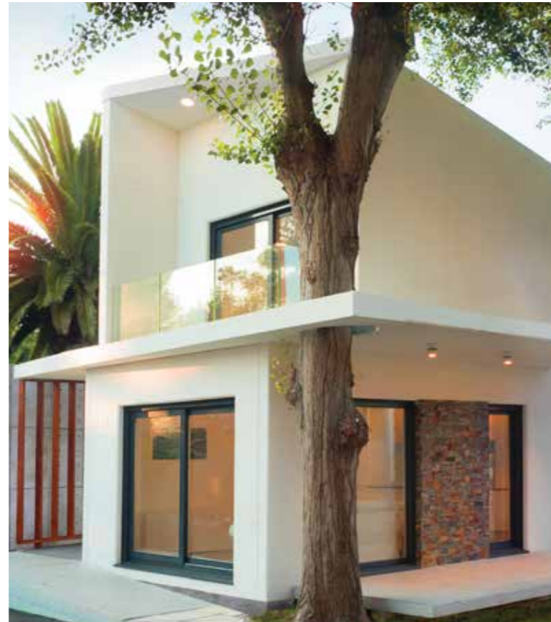
Detalle habitación módulo exterior estándar