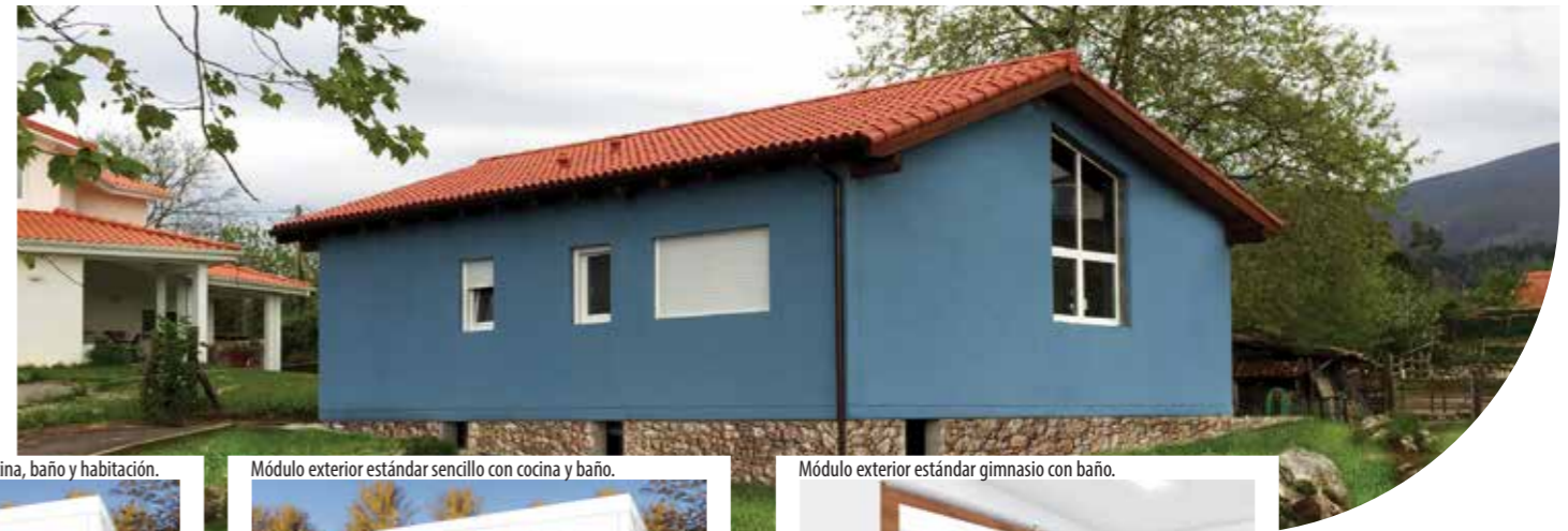
Módulo exterior estándar gimnasio con baño.